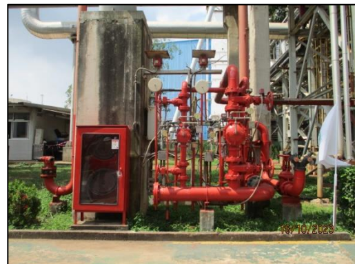
รูปที่ 2-19 อุปกรณ์ตรวจจับควันและอุปกรณ์ดับเพลิง