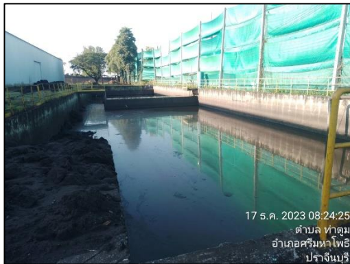
รูปที่ 2-11 บ่อตกตะกอน และบ่อดักไขมัน บริเวณปลายรางระบายน้ำทิ้ง