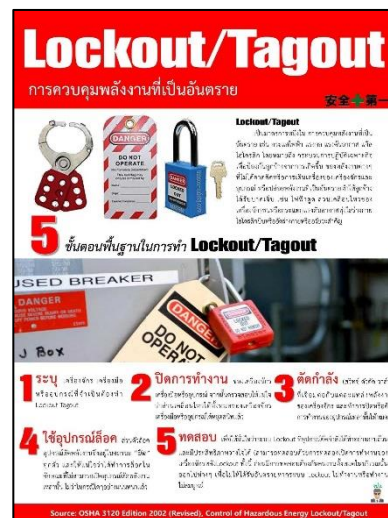
กิจกรรม Safety NEWS