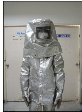
รูปที่ 2-18 ชุดป้องกันความร้อนของพนักงาน