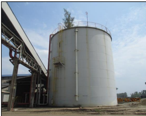
รูปที่ 2-22 ถังเก็บน้ำสำรองดับเพลิง ขนาด 4,000 \text{m}^3