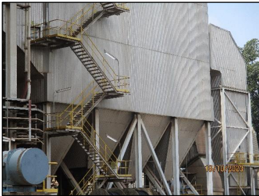
รูปที่ 2-1 ระบบดักฝุ่นแบบไฟฟ้าสถิต (ESP)