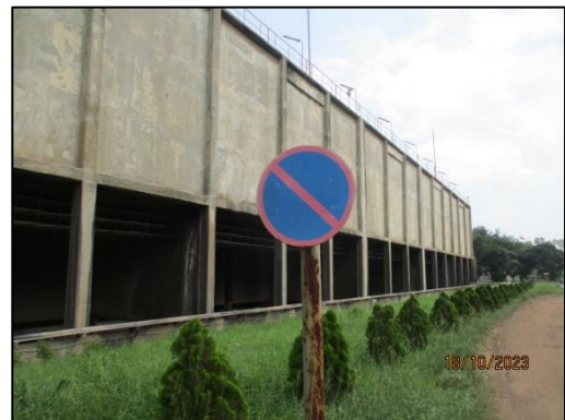
รูปที่ 2-10 ป้ายสัญลักษณ์ด้านการจราจร