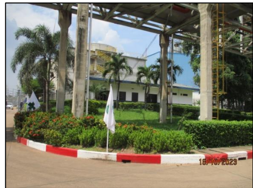
รูปที่ 2-4 พื้นที่สีเขียวภายในโครงการ