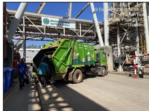
รูปที่ 2-14 การจัดเก็บและรวบรวมขยะมูลฝอย