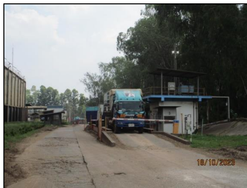
รูปที่ 2-9 บริเวณจุดขังน้ำหนักรถบรรทุก