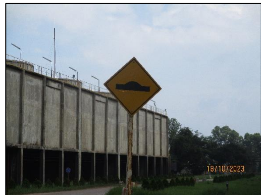
รูปที่ 2-30 ลูกกระพรวนบริเวณถนน