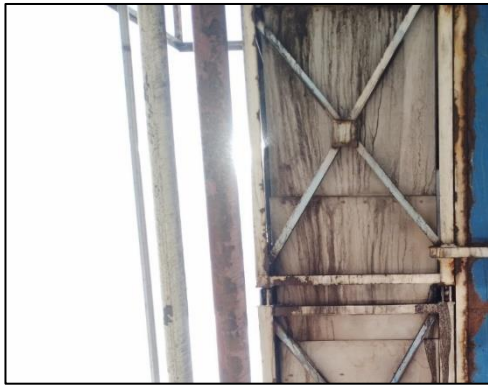
รูปที่ 2-7 Line น้ำที่ใช้รดถ่านหิน