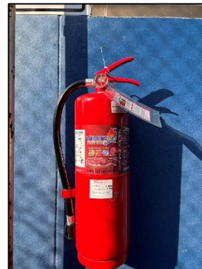
รูปที่ 2-23 ถังดับเพลิงประเภทผงเคมีแห้ง