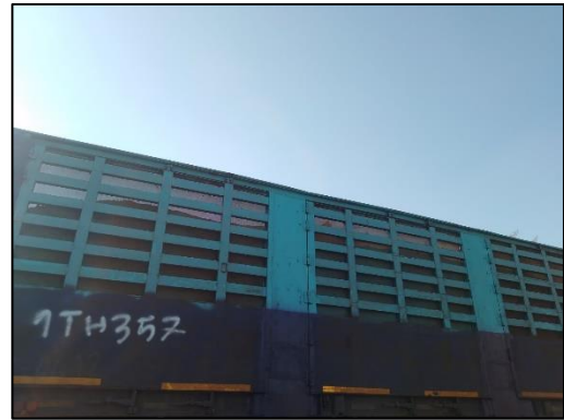
รูปที่ 2-29 การบุด้านในรถบรรทุก ด้วยตาข่ายไนลอนที่มีตาถี่