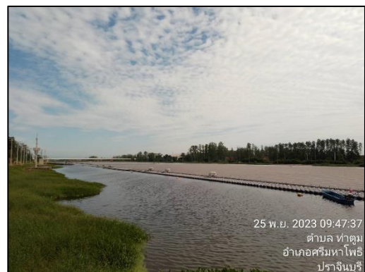
รูปที่ 2-6 บ่อพักน้ำก่อนนำไปรดน้ำต้นไม้ (Irrigation Pond)