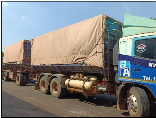
รูปที่ 2-28 การปิดคลุมผ้าใบรถบรรทุก