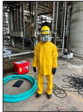
รูปที่ 2-21 การแต่งกายของพนักงาน ด้วยชุดป้องกันสารเคมี