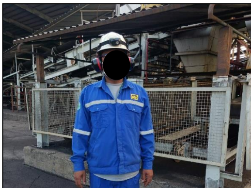
รูปที่ 2-15 พนักงานสวมใส่อุปกรณ์ PPE, หน้ากากกันฝุ่น และที่ครอบหูหรือที่อุดหู