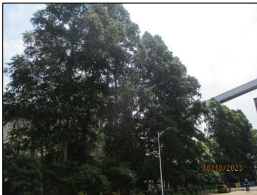
รูปที่ 2-3 แนวป้องกันเสียง (Buffer Zone) รอบโครงการ