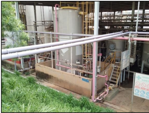
รูปที่ 2-20 กำแพงล้อมรอบถังเก็บสารเคมี