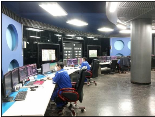
รูปที่ 2-17 ห้องควบคุม (DCS Control Room)