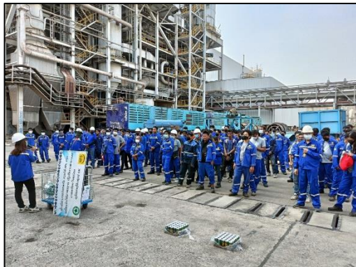
กิจกรรม Safety Talk