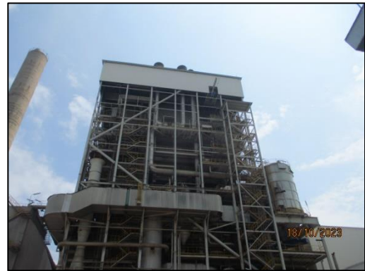
รูปที่ 2-2 เตาเผาชนิด Circulating Fluidized Bed Combustion (CFB)