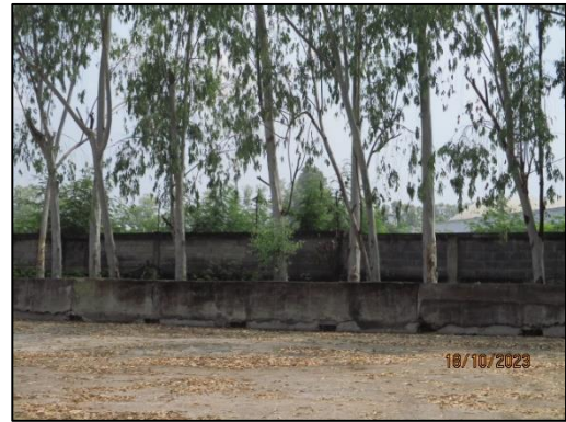
รูปที่ 2-8 คันคอนกรีตรอบบริเวณลาน Bio Fuel