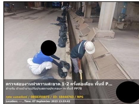
รูปที่ 2-12 การทำความสะอาดรางระบายน้ำทิ้ง