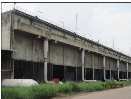
รูปที่ 2-5 Cooling Tower