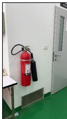
รูปที่ 2-24 ถังดับเพลิงประเภท \text{CO}_2