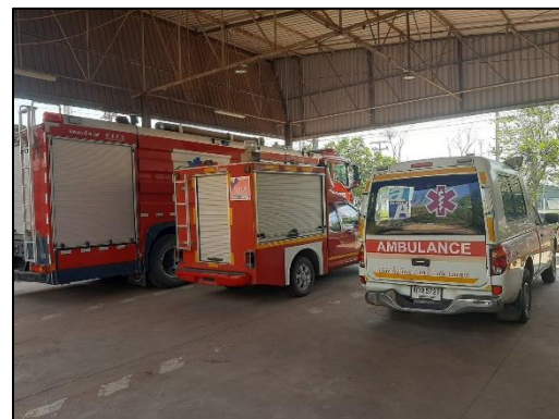
รูปที่ 2-26 รถฉุกเฉิน