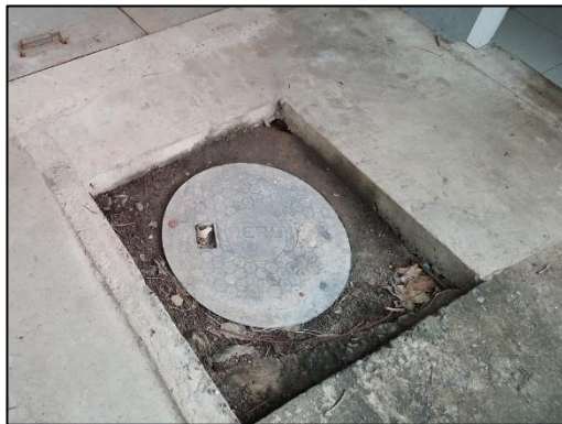
รูปที่ 2-13 Septic Tank