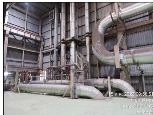
รูปที่ 2-16 ฉนวนหุ้มกันความร้อน